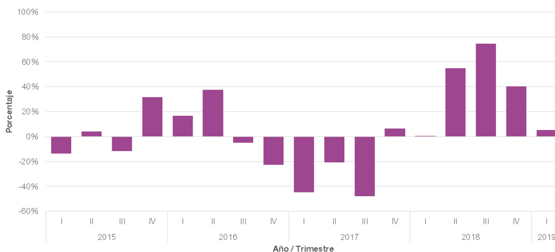
Gráfico N° 2: Superficie cubierta autorizada a construir. Variación porcentual respecto a igual período del año anterior. Municipio de Crespo. Años 2015-2019

Fuente: Oficina Municipal de Estadística.